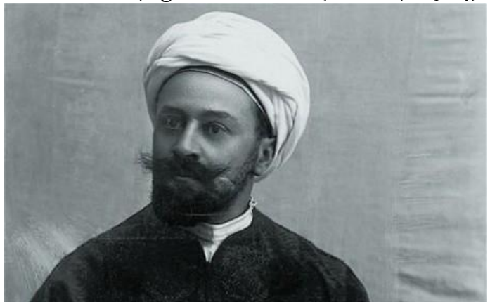
Abb. 1 Max Freiherr von Oppenheim.

Während des Ersten Weltkrieges wurde Berlin zu einem bedeutenden Zentrum politischer Aktivitäten indischer Nationalisten und Revolutionäre. In der, die sich im Sommer 1914 in Deutschland bzw. in Europa aufhielten, verknüpften mit dem Ausbruch des Krieges die Erwartung, von deutscher Seite aktive Unterstützung in ihrem antikolonialen Kampf zu erhalten. Die deutschen Behörden ihrerseits verbanden mit dieser Zusammenarbeit die Hoffnung, antibritische Kräfte zu stärken und eigene Positionen während des Krieges sowie darüber hinaus auszubauen. Dies entsprach der dominierenden deutschen militär- und außenpolitischen Strategie, die Fritz Fischer als „Programm zur Revolutionierung“ charakterisierte. Revolution war aus der Sicht Fischers durchaus ein Kriegsziel, das auf eine Unterstützung antikolonialer Kräfte und damit auf eine Schwächung der europäischen Kolonialmächte, d.h. der Kriegsgegner Deutschlands, gerichtet war (Fischer, 1984; Jenkins, 2013). Ein Mittel zur Umsetzung dieser Zielstellung war die „Aufwiegelung“ antikolonialer Bevölkerungsgruppen im globalen Maßstab. Sie umfasste die Unterstützung von flämischen, irischen oder persischen Nationalisten ebenso wie die Zusammenarbeit mit georgischen, ägyptischen und indischen antikolonialen politischen Kräften. Die von Max von Oppenheim zunächst entwickelte, in der internationalen akademischen Welt intensiv diskutierte deutsche „Jihad-Strategie“ (Loth, 2014; Lüdke,