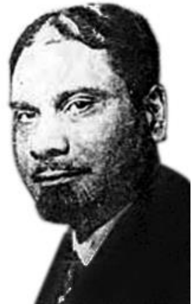
Abb. 4 Chempakaraman Pillai.

stützung zur Aufwiegelung antikolonialer Kräfte hingewiesen und dafür die Gründung einer speziell darauf ausgerichteten Institution angeregt, der "Nachrichtenstelle für den Orient". Was auf den ersten Blick den Anschein eines Übersetzungs- und Informationsbüros erweckte, war eine Institution von weitreichender propagandistischer und nachrichtendienstlicher Bedeutung. Hier wurden Strategien zur Propaganda auf unterschiedlichen Ebenen entwickelt: in den Kolonien und abhängigen Gebieten, unter den Kolonialsoldaten an der Front und in den Gefangenenlagern sowie in neutralen Ländern. In unterschiedlichen Sprachen wurden entsprechende Materialien erarbeitet, gedruckt und verbreitet. Mitarbeiter der NfO waren sowohl Deutsche (neben Diplomaten auch Wissenschaftler, Missionare, Geschäftsleute) als auch Vertreter der verschiedenen kolonialen und abhängigen Regionen. Neben der Nachrichtenstelle für den Orient war die Sektion III b der Politischen Abteilung des Stellvertretenden Generalstabes unter Rudolf Nadolny für Entscheidungen und Strategien im Bereich der Propaganda zuständig. Alle Aktivitäten erfolgten so mit Billigung und unter Kontrolle des Auswärtigen Amtes und der Obersten Heeresleitung.